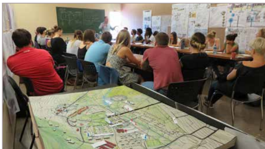
IMPRESSIE VAN DE RONDE-TAFELBIJEENKOMST OP DE UNIVERSITEIT VAN PRETORIA, MET EEN STUDIEMAQUETTE OP DE VOORGROND.

Maar de verbetering van de waterhuishouding op de heuvel vraagt nog wel extra studie en nieuwe investeringen. Intussen gaat de groei van de 'urban sprawl' – kleine huisjes op kleine kavels, in grote aantallen – onverminderd door. Het wordt dan ook een grote uitdaging voor het stadsbestuur om de toekomst van Westfort Village in goede banen te leiden. De perspectieven hiervoor liggen nog open. Wellicht zijn de aangedragen ideeën van de studenten uit Pretoria en Delft een goede stimulans om tot integrale aanpak van behoud en ontwikkeling te komen van Westfort Village als groene oase met Hollandse wortels.