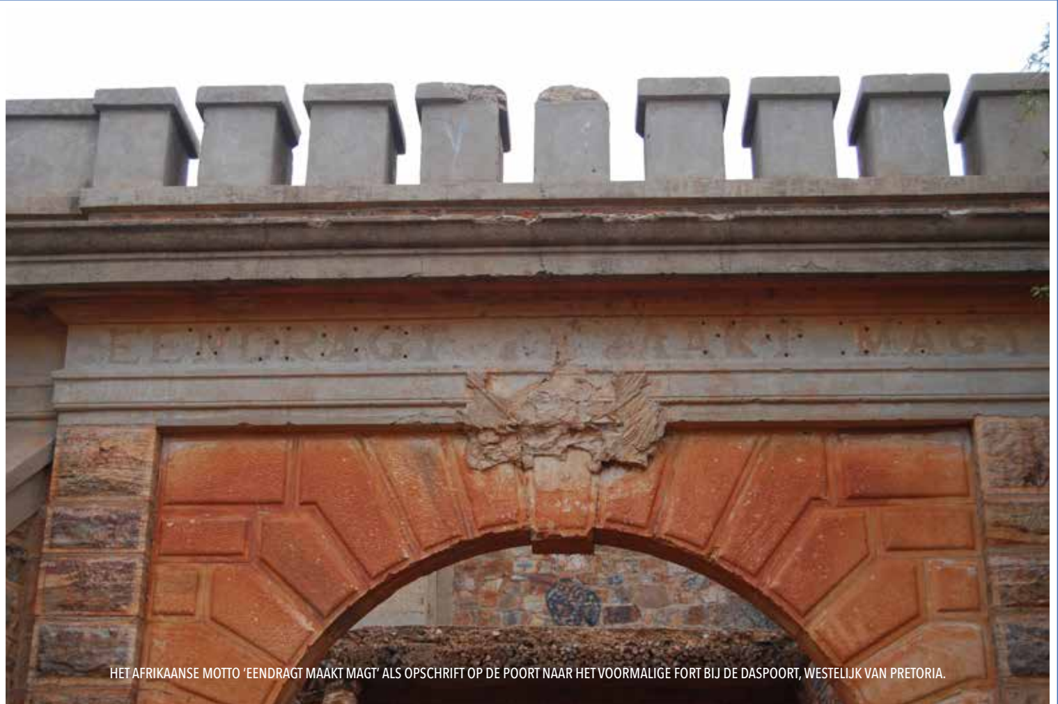
HET AFRIKAANSE MOTTO 'EENDRAGT MAAKT MAGT' ALS OPSCHRIFT OP DE POORT NAAR HET VOORMALIGE FORT BIJ DE DASPOORT, WESTELIJK VAN PRETORIA.

In Zuid-Afrika even buiten Pretoria ligt Westfort Village, een bijna vergeten enclave met Hollands ogende gebouwen. Het geïsoleerde dorp werd ruim een eeuw geleden gesticht als leprozenkolonie. Nu wonen er circa 4.000 mensen - zonder stromend water of elektriciteit. Studenten van de universiteiten van Pretoria en Delft doen ontwerpend onderzoek voor een nieuwe toekomst.