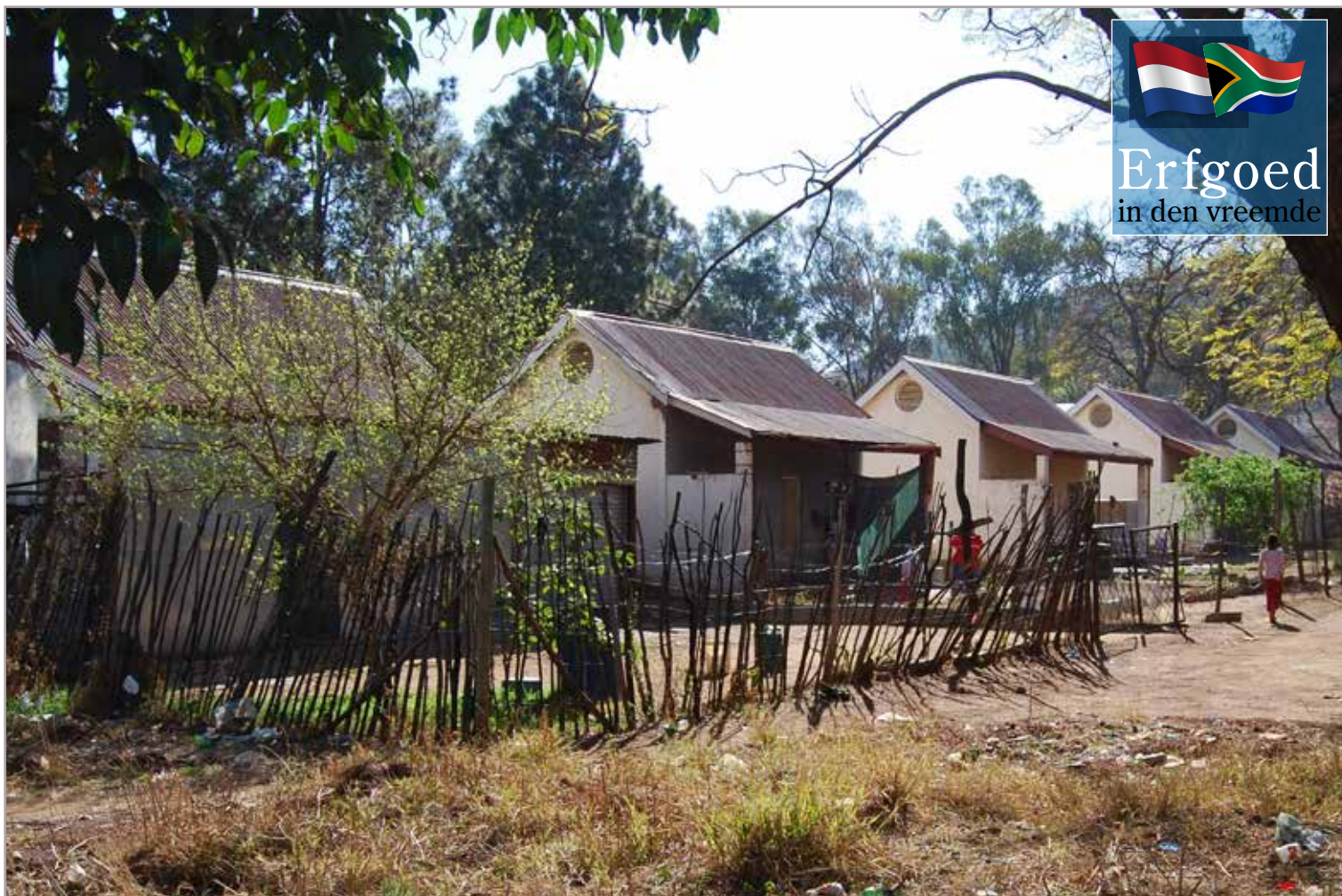
CLUSTER VAN VOORMALIGE PATIËNTENWONINGEN VAN WESTFORT VILLAGE.