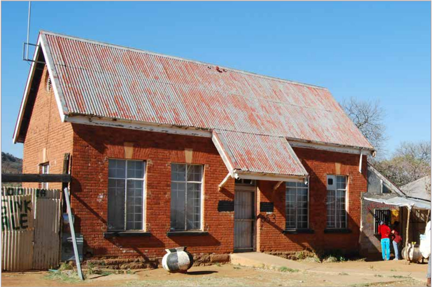
VOORMALIG POSTKANTOOR VAN WESTFORT VILLAGE.

jaren tachtig van de vorige eeuw medicatie beschikbaar is. Het eerste ziektegeval in Pretoria werd gemeld in 1888, waarna enkele provisorische voorzieningen volgden. Met de groei van de hoofdstad nam ook het aantal patiënten toe. Hiervoor ontwierpen architect Sytze Wopkes Wierda en zijn