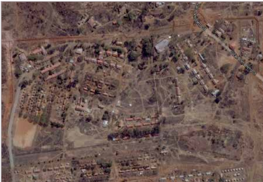
ACTUELE SATELLIETFOTO VAN WESTFORT VILLAGE (WWW.GOOGLE.MAPS).

De enclave bevatte kleine clusters van eendaagse gebouwen voor patiënten en - apart - personeel, deels met (moes) tuinen. Verder waren er een hospitaal, apotheek, administratiegebouw, postkantoor, politiepost, gevangenis, winkels, kerken en een school.