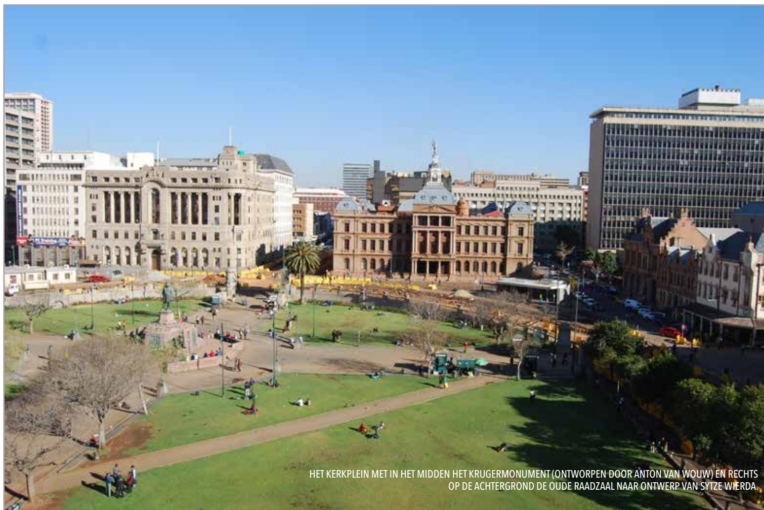
HET KERKPLEIN MET IN HET MIDDEN HET KRUGERMONUMENT (ONTWORPEN DOOR ANTON VAN WOUW) EN RECHTS OP DE ACHTERGROND DE OUDE RAADZAAL NAAR ONTWERP VAN SYTZE WIERDA.

Pretoria heeft een bijzondere band met Nederland. De geschiedenis gaat terug tot de tijd van de Zuid-Afrikaansche Republiek en de bestemming van Pretoria tot nationaal bestuurscentrum in 1860. Toenmalig president Paul Kruger wilde de autonomie van 'zijn' Boerenrepubliek in de Transvaal