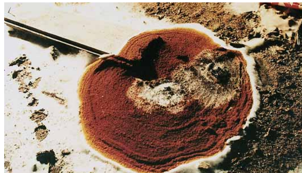
Vruchtlichamen van de huiszwam in plaatvorm. De huiszwam vormt vaak vruchtlichamen op de overgang hout - muur (foto rechtsboven) of op kruipruimtebodems (boven)

Door regelmatige controle op kleine onderhoudsgebreken en herstel daarvan, bijvoorbeeld door de Monumentenwacht, kunt u vochtproblemen signaleren en verhelpen nog voor schimmels zich kunnen ontwikkelen. Ook houden deze onderhoudsinspecties de herstelkosten binnen de perken, mocht er onverhoopt toch schimmelaantasting zijn ontstaan. De besproeiing van complete ruimten of constructies heeft, we zeiden het al eerder, nauwelijks preventieve werking.