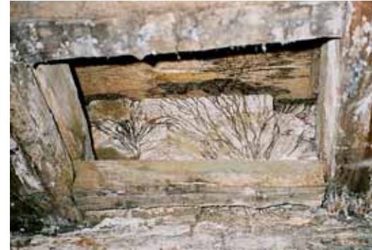
Strengen van de kelderzwam

water aan te voeren met zijn strengen. De huiszwam kan inderdaad vocht van natte naar droge plekken verplaatsen, maar dit kan hij niet onbeperkt. In constructies met enige ventilatie gaat het aangevoerde water weer verloren en slaagt de huiszwam er niet in om voldoende water aan te voeren. Zelfs een geringe hoeveelheid ventilatie is hier al voldoende voor. Daarom heeft ook de huiszwam een houtvochtgehalte nodig van ongeveer 22 procent.