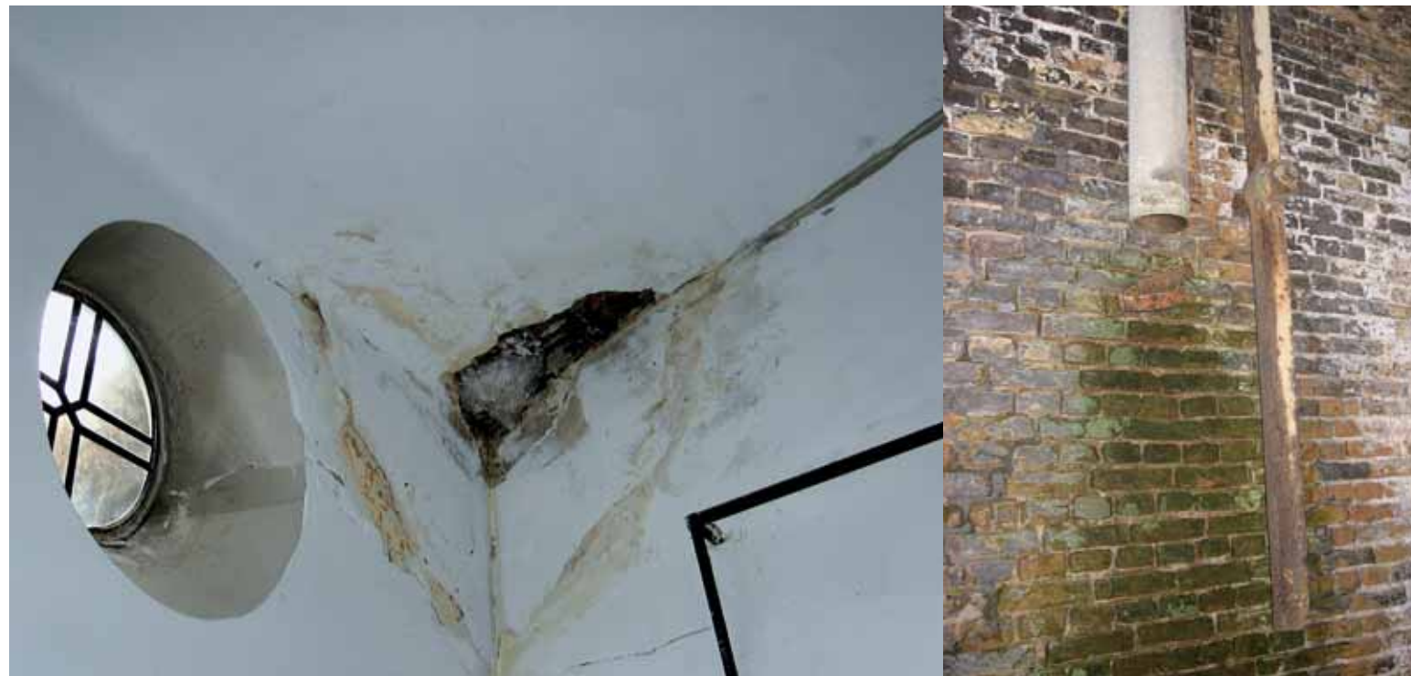
Schimmelaantasting ontstaat altijd door vochtproblemen, zoals lekkages. Die opsporen is de eerste en meteen ook de belangrijkste maatregel tegen schimmels

ernstige schimmelaantasting. Volg door de tijd het droogproces met vochtmeters. Die zijn weliswaar niet geheel nauwkeurig, maar dat vormt bij terugkerende metingen geen probleem. Herhaalde metingen vertellen u namelijk wel hoe het droogproces verloopt. Meet steeds met hetzelfde type meter en steeds op dezelfde plaatsen. Daar horen altijd de plaatsen bij die vaak vochtig zijn, zoals balkkoppen, muurplaten en muurstijlen. Afhankelijk van de meetresultaten en de bouwkundige situatie kunt u het droogproces versnellen door bijvoorbeeld extra te ventileren. Elektrische weerstandsmeters zijn het meest praktisch en snel. Dit zijn vochtmeters voorzien van twee pennetjes die u in het hout steekt. Gebruik alleen vochtmeters die rekening houden met de houtsoort en de temperatuur. Meet niet aan het oppervlak, maar diep in het hout. Zoals met een ram-elektrode, een vochtmeter voorzien van lange, geïsoleerde pennen. Ga verstandig met vochtmeters om en vertrouw ze niet blindelings. In volstrekt droog hout kunnen vochtmeters namelijk soms hoge vochtwaarden