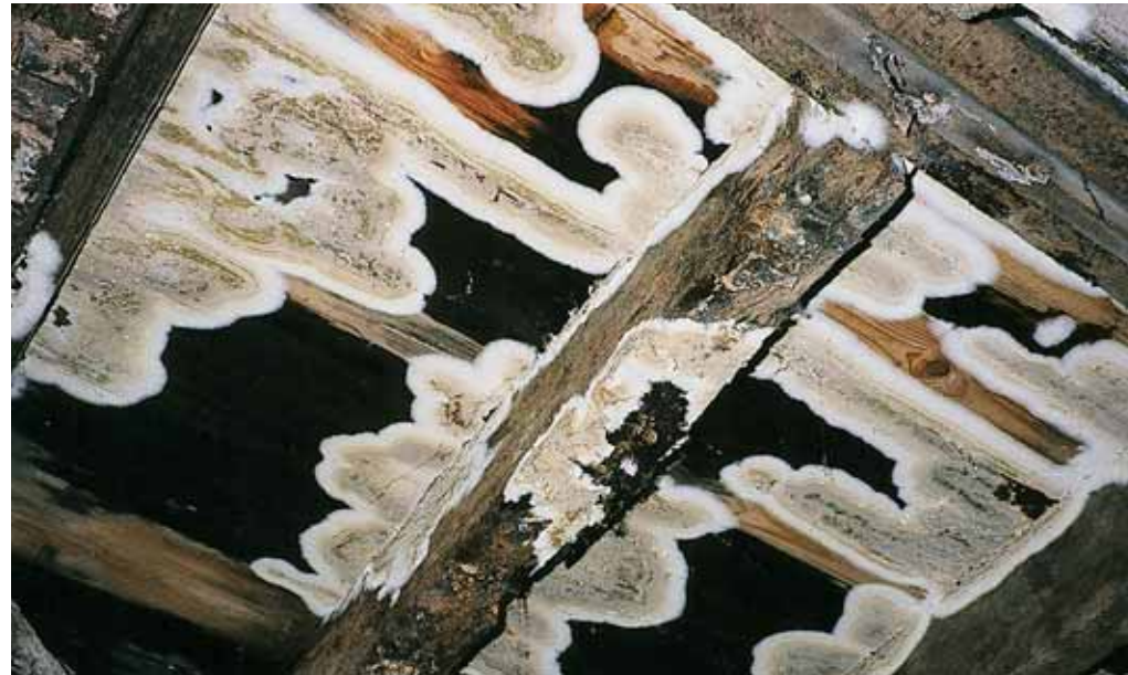
Vruchtlichamen van de kelderzwam. Deze vruchtlichamen worden gemakkelijk verward met die van de huiszwam

maar laat ten minste één zijde vrij. Dit om te voorkomen dat water in de balkkop opgesloten raakt als de muur later opnieuw vochtig wordt.