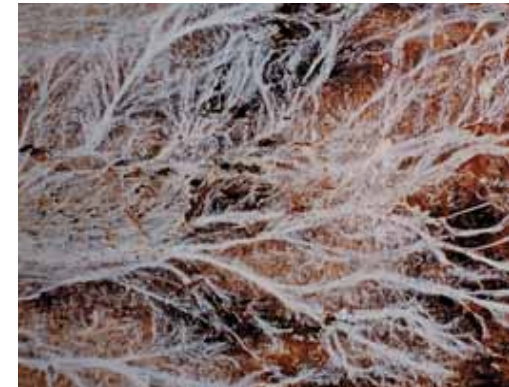
Strengen van de poriëzwam